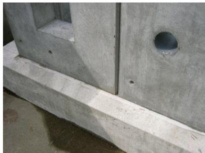
シリカフェーム混入 高強度コン打上り面