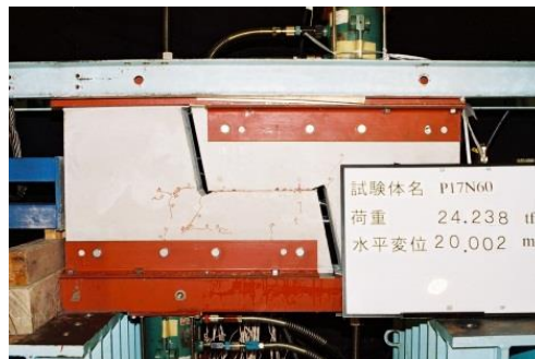
ジョイント部実験

ジョイント部の鉄筋の収まりを工夫し、実験によりその挙動を検証、現場作業の省力化を提案します。