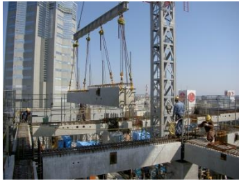
効率的な施工 (プレキャスト工法)

コンクリートは外力に対して変形しにくく、耐火性に優れ、遮音性が良いことから、居住性が必要とされる集合住宅・学校・病院など様々な構造物に利用されています。