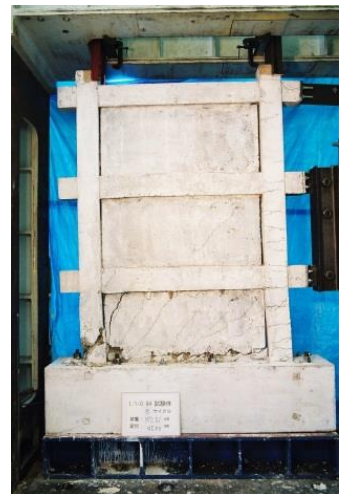
プレキャスト壁実験