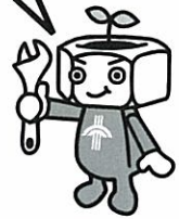
マスコットキャラクター つくっ太郎