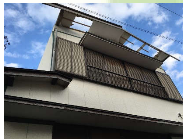
被災した住宅の例

台風15号の特徴や被害状況を紹介しながら、風災害発生メカニズムやそれに対する建築・都市づくり上の備えについて、解説します。