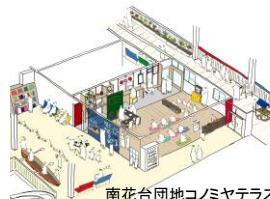
南花台団地コノミヤテラス