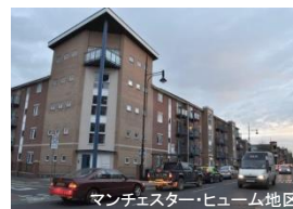
マンチェスター・ヒューム地区

また、「まず、やってみる！」という実践活動も重要で、団地の中に地域コミュニティ拠点の運営にも取り組んでいます。