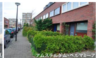
アムステルダム・ベルミーア