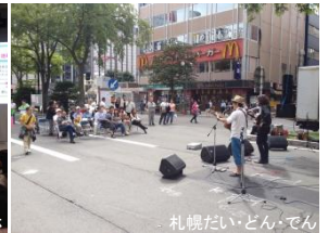
札幌だい・どん・でん