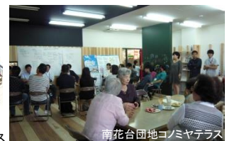
南花台団地コノミヤテラス