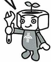
マスコットキャラクター つくっ太郎