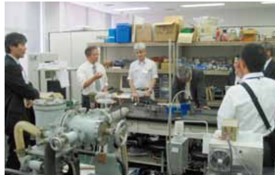
加工プロセスによる新材料の開発に関する研究紹介 (加工プロセス工学研究室)