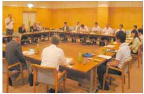
新潟地域懇談会の様子