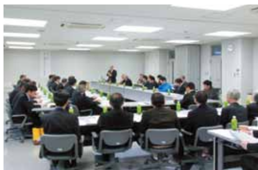
両地域の取組事例の紹介の様子