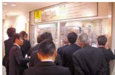
北陸コココーラボトリング砺波工場