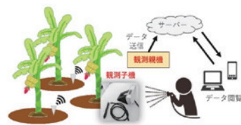
土壌水分モニタリングシステムの構成

「越後バナナ」は、柏崎市にあるシモダファームが、その母体であるシモダ産業株式会社の産業廃棄物処理事業の過程で発生する排熱を活用したサーマルリサイクル栽培で農薬不使用のバナナブランドです。この栽培には最適な生育環境を保つため、非常にきめ細やかな環境管理が重要です。そこで、本学の佐藤栄一教授は、効率的な水やりの頃合いを計るモニタリングシステム基盤構築にむけて連携して取り組んでいます。バナナの株元に小型ソーラーパネルで動作するセンサーを設置し、管理者はwebを通じて、パソコンやスマート